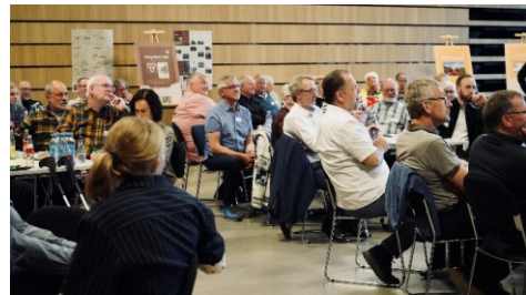
Masser af talelyst blandt de 75 deltagere, fordelt på 22 lokalråd og Vejle byråd